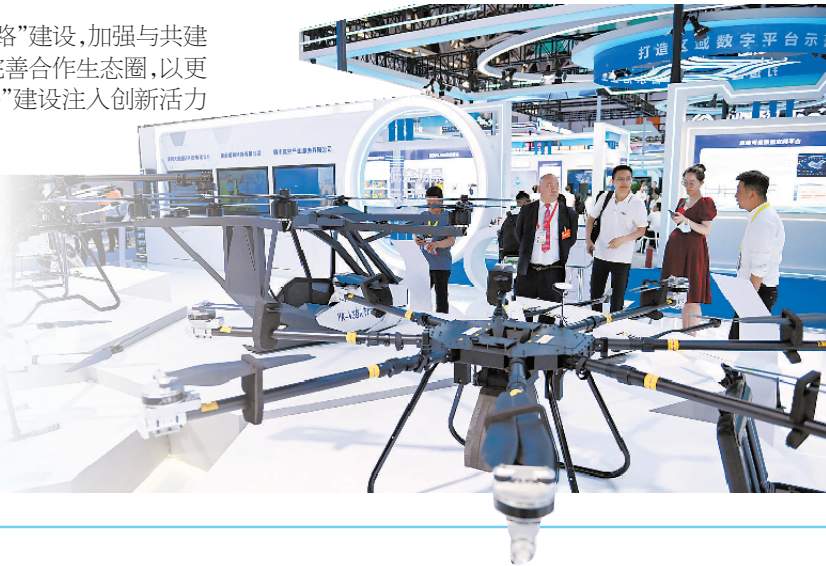
图为在第九届丝绸之路国际博览会暨中国东西部合作与投资贸易洽谈会低空经济展上,参观者了解各类飞行器。

据悉,本届丝博会聚焦现代能源、先进制造、文化旅游、战略性新兴产业、现代农业、基础设施、商贸物流、节能环保等多个领域,包装重点项目1000个左右。在此基础上,大会筛选了149个重点推介项目,投资总额超2000亿元,进一步增强丝博会扩开放、引外资的特色吸引力。在5天会期里,八方宾朋将借助丝博会平台共谋合作发展、共享发展机遇,汇聚经济发展澎湃动力,奏响互利共赢新乐章。