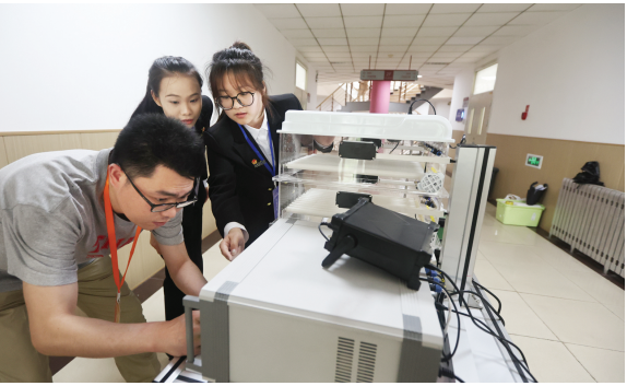
图为天津职业大学学生团队参赛项目“水蛭卵茧声波无土孵化器”。

据了解,此次共有280个项目入围市级决赛,按专业分为8个组。组委会邀请各领域专家担任评委,采用“作品陈述+评委问辩”的线下封闭答辩方式,评选市级获奖项目并遴选推荐国赛项目。