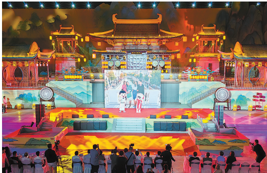
“5·19中国旅游日”天津分会场启动仪式在武清区运河不夜城举办。

本报讯(记者 廖晨霞)“5·19中国旅游日”天津分会场启动仪式昨晚在武清区运河不夜城举行。今年的“中国旅游日”活动期间，我市精心策划主题月近300场文旅活动、推出58项惠民举措，让广大市民游客享受旅游日带来的欢乐与实惠。