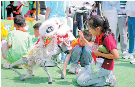
参加津南区旅游日活动的学生与机器人进行互动。

本报讯(记者 徐丽)昨日，津南区“5·19中国旅游日”主题活动在双桥河镇孙庄子村举办。活动以“津彩南望·美好旅程”为主题，通过文艺展演、智慧体验、惠民推介等多元形式，全面展现津南农文旅融合发展的新成果。