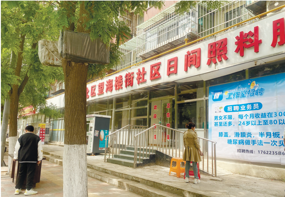
河北区望海楼街社区日间照料服务中心外玻璃墙张贴广告