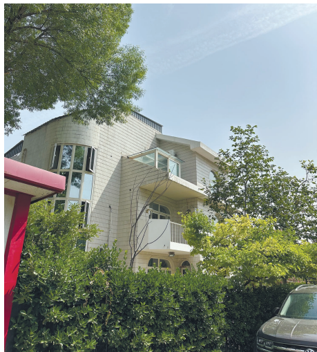
水云花园小区违章建筑

目前按照相关规定,已限制该处违法建设别墅的交易。另外,由于别墅的违建和合规建设的地方已经浑然一体,执法部门无法确定违建面积,加上当事人并不配合,执法人员无法进入测量,因此还需找寻相关历史资料,并与社区配合,找第三方进行测绘。