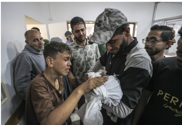
5月14日,在加沙地带北部杰巴利耶地区,巴勒斯坦人悼念遇难者。

据外媒评论,鉴于哈马斯12日释放了美以双重国籍被扣押人员艾丹·亚历山大,加沙地带的巴方平民希望美国总