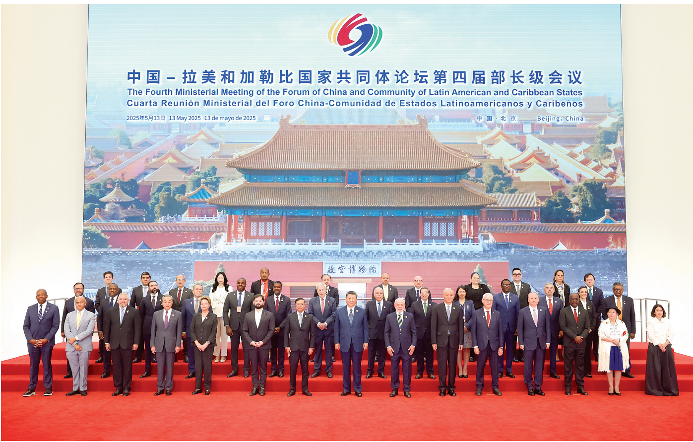
5月13日上午，国家主席习近平在北京国家会议中心出席中国—拉美和加勒比国家共同体论坛第四届部长级会议开幕式并发表主旨讲话。这是习近平同与会嘉宾集体合影。