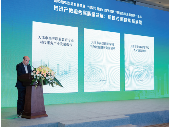
▲发布《天津市高等职业教育专业对接产业发展报告》

2024年11月20日至22日，世界职业技术教育大会在天津盛大举行。大会期间，部长级圆桌会议有中国等32个国家教育或相关部门负责人参会，讨论通过了《世界职业技术教育发展天津共识——32国部长宣言》，为世界职业技术教育发展规划愿景。大会设置6场平行会议，围绕产教融合推动职业教育高质量发展等关键议题展开深入交流。同时，世界职业技术教育发展联盟正式成立，来自全球五大洲43个国家和地区的89个机构成为首批成员。天津职业学校积极参与大会，天津轻工职业技术学院协理世界职教联盟秘书处工作，负责“未来非洲”职教合作项目秘书处职责，承办中国—赞比亚职教研讨会。会议以“校企协同·中赞合作·创新发展”为主题，吸引政校企行等30余家单位60余人参会，旨在深化中非职教合作，推动产教融合，促进民心相通，共筑中非友好合作精神。天津电子信息职业技术学院参加2024年世界职业技术教育大会中以“高技能人才培养的全球战略与实践”为主题的平行会议，做职业教育数字化转型的实践路径的经验分享。