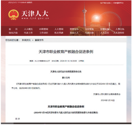
▲天津市发布全国首部职业教育产教融合促进条例