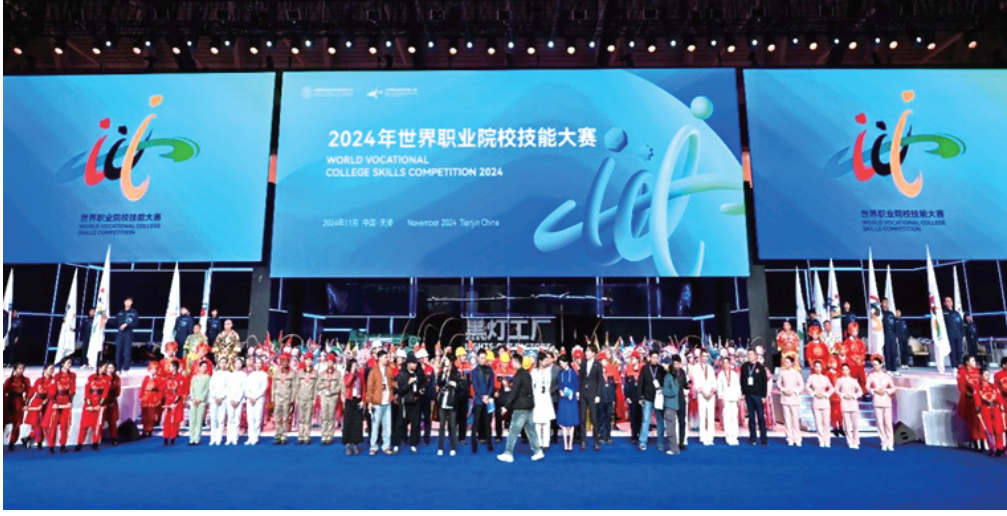
▲2024年世界职业院校技能大赛比赛现场

天津职业教育历史悠久、特色鲜明、积淀深厚。近代发轫，百年赓续，伴随工业发展启蒙实业教育；迈入新时代，十年磨一剑，部市连续携手共建示范标杆；踏上新征程，打造新高地，全力探索现代职教体系改革新模式。天津始终立足服务人的全面发展、服务经济社会发展和服务国家重大发展战略来谋划和发展职业教育，坚持产教融合、校企合作、工学结合、知行合一，扎实推进现代职业教育体系建设改革，形成了一系列行之有效的经验做法，取得标志性成果。2024年续写职业教育创新新篇章。