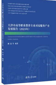
▲《天津市高等职业教育专业对接服务产业发展报告(2023)》由清华大学出版社出版

标体系，系统梳理了高等职业教育对接服务产业发展情况，全面呈现我市高等职业院校服务产业发展的做法与成效，分析了天津市高等职业教育改革发展的趋势和针对性建议，客观呈现天津市高等职业教育“做了什么”“做得怎样”，进一步推进天津市职业教育产教融合创新发展。研究框架和指标注重整体实践与典型案例结合、常态化指标与实时性指标结合、代表性指标与可得性指标结合、定性与定量结合，充分考虑研究指标背后的真实含义和数据采集难易程度，力求全面呈现，确保研究结果客观、准确地反映天津市高等职业教育专业对接服务产业发展的现实。同时，客观反映天津市高等职业学校对接服务产业的发展水平、做法及成效，展现天津市高等职业教育服务天津市经济产业高质量发展的适应性，突出服务产业的需求和领域、对接产业的重点和关键，对天津市职业教育未来发展具有较强的引领作用。