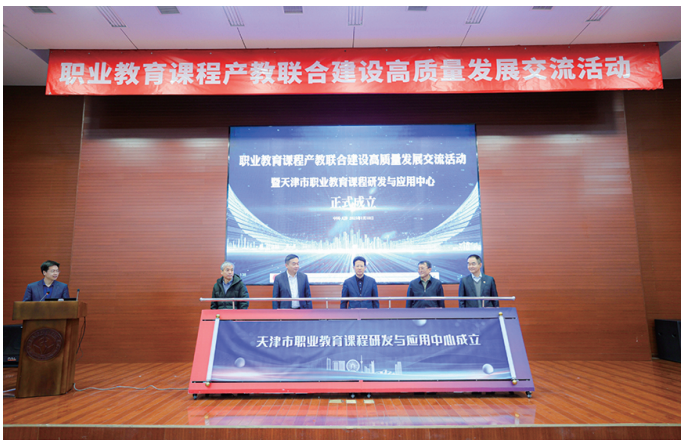
▲天津市职业教育课程研发与应用中心成立

同期，天津市教育委员会、河北雄安新区管理委员会签署“关于职业教育协同创新发展合作协议”，充分发挥天津职业教育改革创新优势，更好服务雄安新区建设。协议明确，双方在深入开展职业教育协同研究、持续强化职业院校合作、系统加强职教师资队伍建设、大力开展职业技能培训、合作提升职业教育国际化水平、共同推进学习型新区建设六个方面共同探索现代职业教育体系建设新模式，建立完善高素质技能人才培养培训体系，提升雄安新区职业教育质量，助力雄安新区经济社会和产业发展。