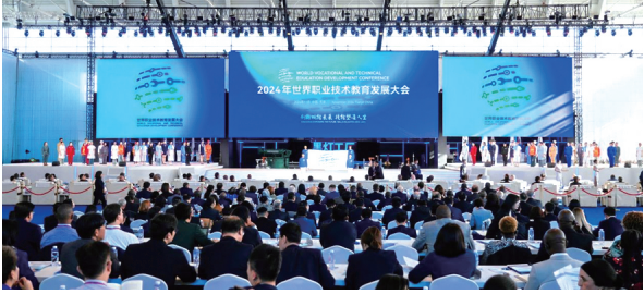
▲2024年世界职业技能教育发展大会现场