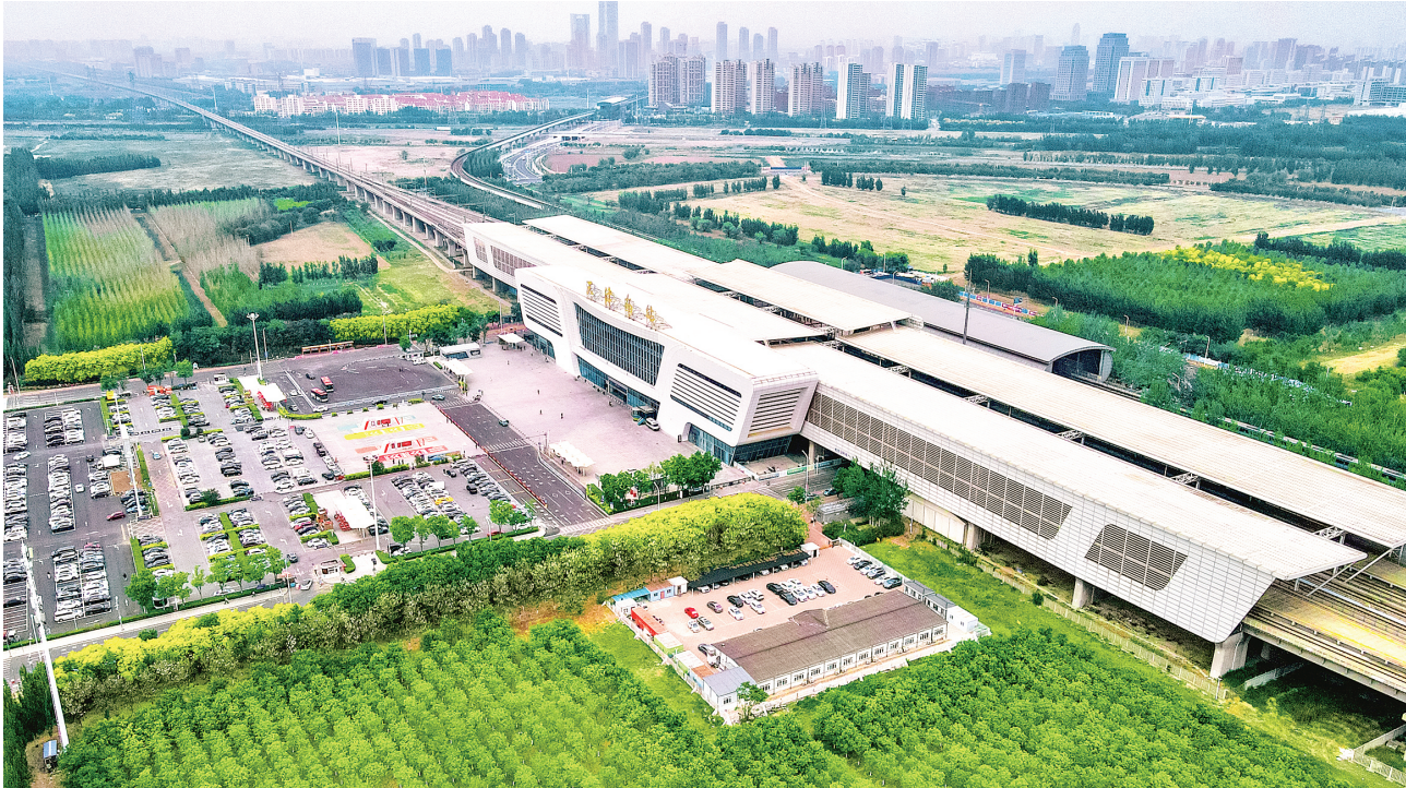
位于西青区张家窝镇的天津南站科技商务区，众多科技企业扎根生长，高端配套项目不断集聚。

“站”的流量、“产”的质量，赋能城市发展增量，站产城融合度越深，城市吸引力、发展动力也就越足。