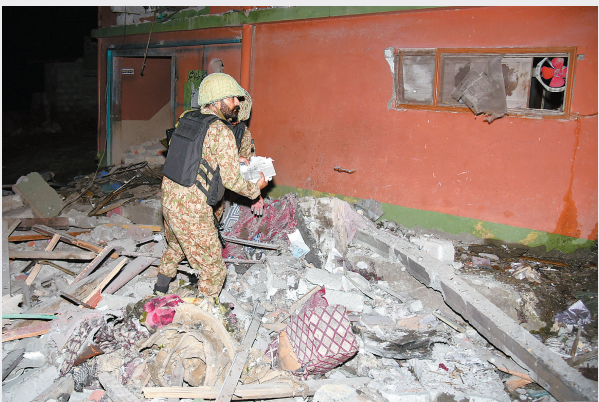
上图 5月7日,军人在巴控克什米尔地区首府穆扎法拉巴德一处遭到空袭的地点查看损失情况。