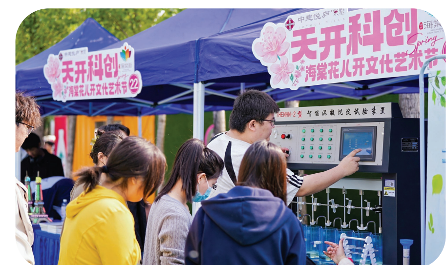
“海棠花儿开”文化艺术节科创展示区,市民操作智能试验装置。