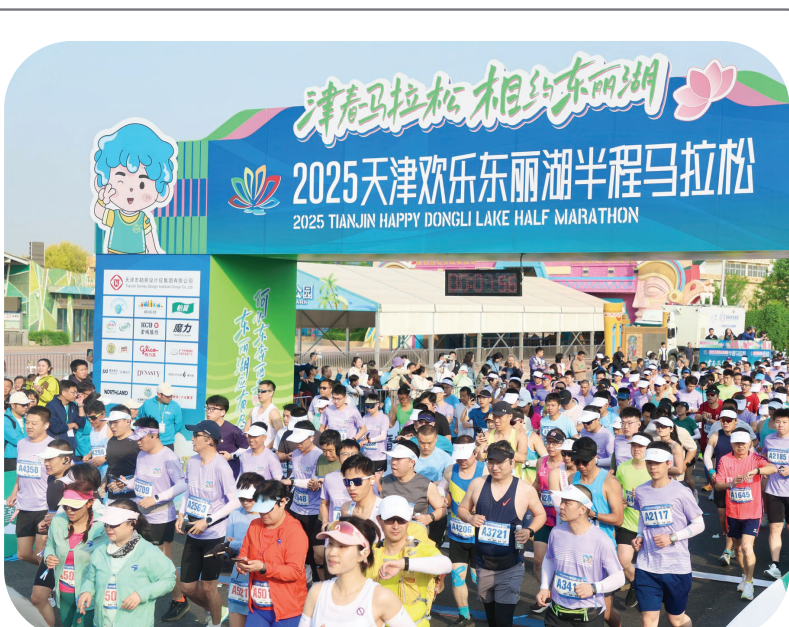
2025天津欢乐东丽湖半程马拉松开跑。