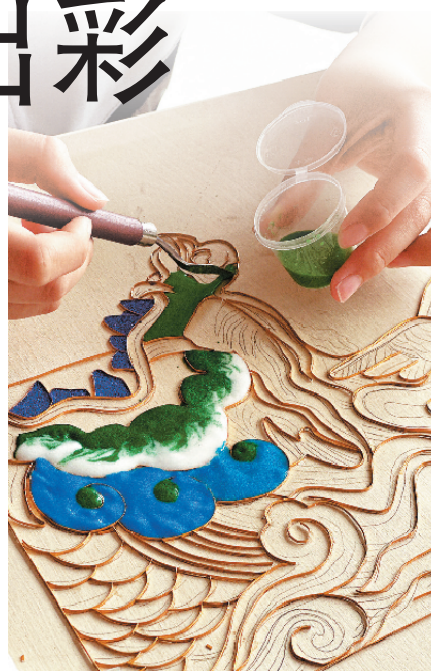
中学生尝试掐丝珐琅工艺制作。