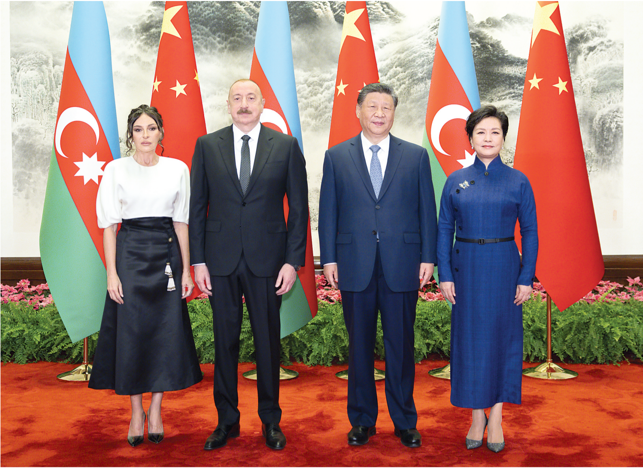
4月23日上午，国家主席习近平在北京人民大会堂同来华进行国事访问的阿塞拜疆总统阿利耶夫举行会谈。这是习近平和夫人彭丽媛同阿利耶夫和夫人阿利耶娃合影。