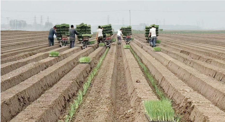
宝坻区王卜庄镇耶律各庄村的种植户使用移栽机种植大葱。

除了引进机械化的种植技术,王卜庄镇还在不断尝试种植新品种,现在种植的葱苗就是最近引进的新品种“盛夏金箍”,前期由农技专家指导农户进行对比种植,与传统品种相比,其葱白更长,抗倒伏性更强,更能适应北方地区多变的春季气候。而且这个品种的大葱生长周期短,现在移栽八月份就能上市,相比其他春播品种能早上市近20天,且亩产能提高15%左右。