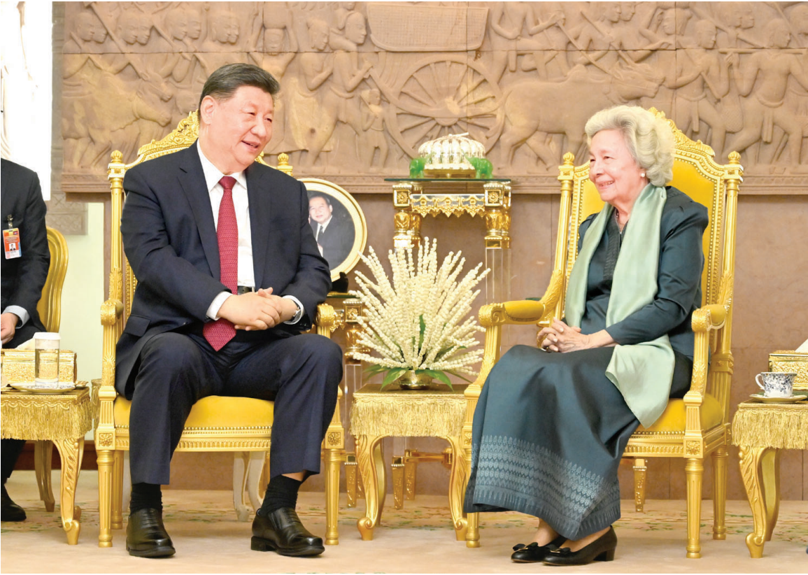
4月17日晚，国家主席习近平同柬埔寨太后莫尼列在金边王宫举行会见。