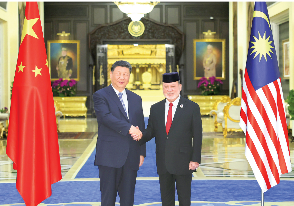
4月16日上午,马来西亚最高元首易卜拉欣在马来西亚国家王宫同中国国家主席习近平举行会见。

新华社吉隆坡4月16日电(记者 杨依军 孙浩)4月16日上午,马来西亚最高元首易卜拉欣在马来西亚国家王宫同中国国家主席习近平举行会见。 4月的吉隆坡,阳光明媚,草木葱茏。易卜拉欣在国家王宫广场为习近平举行隆重欢迎仪式。习近平乘车抵达时,易卜拉欣和马来西亚总理安瓦尔在下车处热情迎接。两国元首登上检阅台,军乐团奏中马两国国歌,鸣礼炮21响。习近平检阅仪仗队。两国元首进入国家王宫大厅,同双方陪同人员握手致意。 欢迎仪式后,习近平会见易卜拉欣。 习近平指出,中国和马来西亚是好邻居、好朋友、好伙伴,常来常往、亲如一家。两国关系走过了波澜壮阔的半个世纪,正迎来更加美好的前景。我愿同易卜拉欣最高元首一道努力,引领中马关系长期稳定发展,共同打造高水平战略性中马命运共同体,谱写睦邻友好、团结合作新篇章,开启中马关系新的“黄金50年”。 习近平强调,中马双方要持续深化政治互信,在涉及彼此核心利益和重大关切问题上相互支持。要深化发展战略对接,优势互补、互利共赢,携手走好现代化道路。建设好“两国双园”、东海岸铁路等重大项目,抓紧培育人工智能、数字经济、绿色经济等未来产业合作。中方欢迎更多马来西亚优质