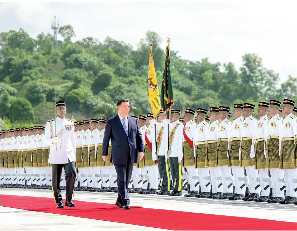
4月16日上午,马来西亚最高元首易卜拉欣在马来西亚国家王宫同中国国家主席习近平举行会见。易卜拉欣在国家王宫广场为习近平举行隆重欢迎仪式。这是习近平检阅仪仗队。