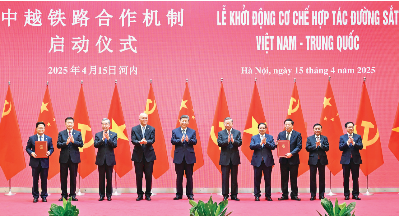
4月15日上午,中共中央总书记、国家主席习近平在河内国际会议中心同越共中央总书记苏林、越南国家主席梁强共同会见中越人民大联欢活动代表。这是活动后,习近平同苏林、范明政共同见证中越铁路合作机制启动仪式。