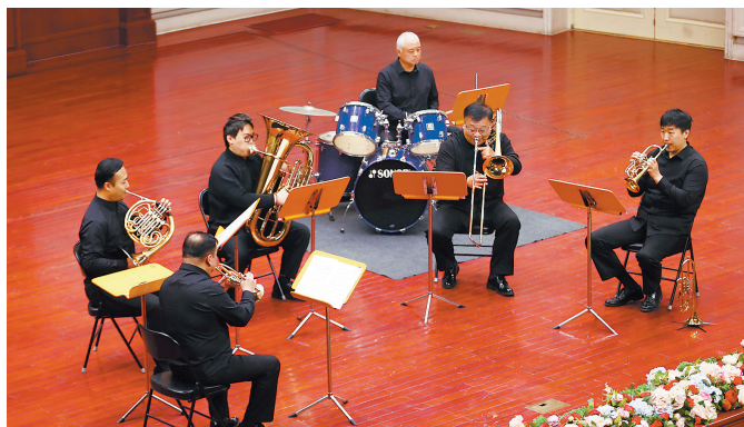
13日,天津交响乐团“周日音乐下午茶”亮相天津音乐厅,带来了“流金岁月系列音乐会之三——嘹亮号角”铜管五重奏中外名曲专场音乐会。