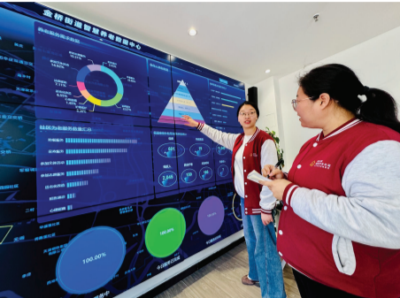
智慧养老服务中心里,工作人员正在通过数据大屏了解老人的相关信息。