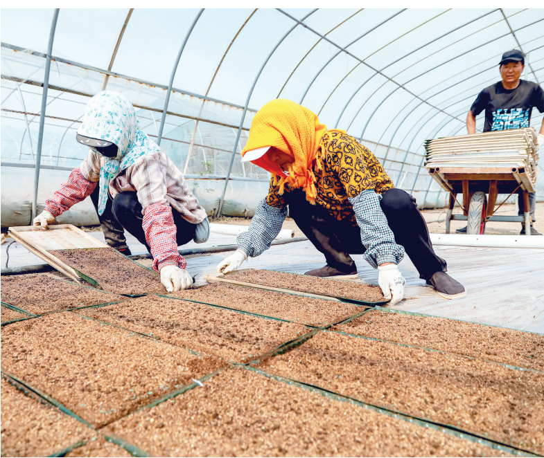
在西青区王稳庄镇的国家粳稻中心,自主研发的“天隆粳5号”等新品种水稻开始育秧。