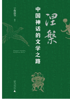
《涅槃：中国神话的文学之路》，宁稼雨等编著，广西师范大学出版社 2024年8月出版。

本书清晰地展现了中国神话与文学相互依存、相互促进的紧密关系。神话为文学提供了丰富的素材，成为文学创作的源泉和根基。从古老的神话传说中，文学获得了无尽的灵