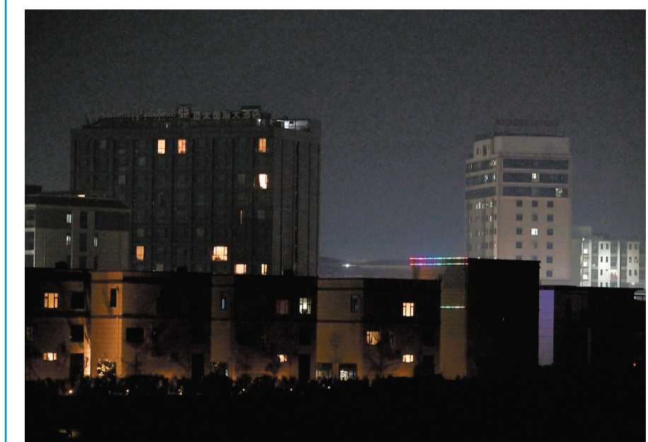
图为2月4日晚从泰国达府洞索拍摄的泰国与缅甸边境地区。