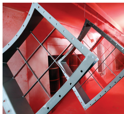
河南省焦作市温县经济开发区一家企业的工人正在进行喷塑作业。