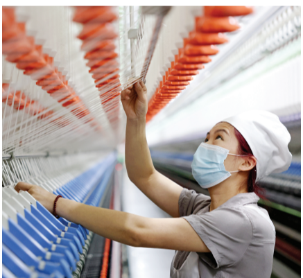
山东省枣庄经济开发区一家企业工人在加工高端纱线。