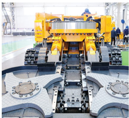
河北省石家庄煤矿机械有限责任公司工人在车间组装掘进设备。