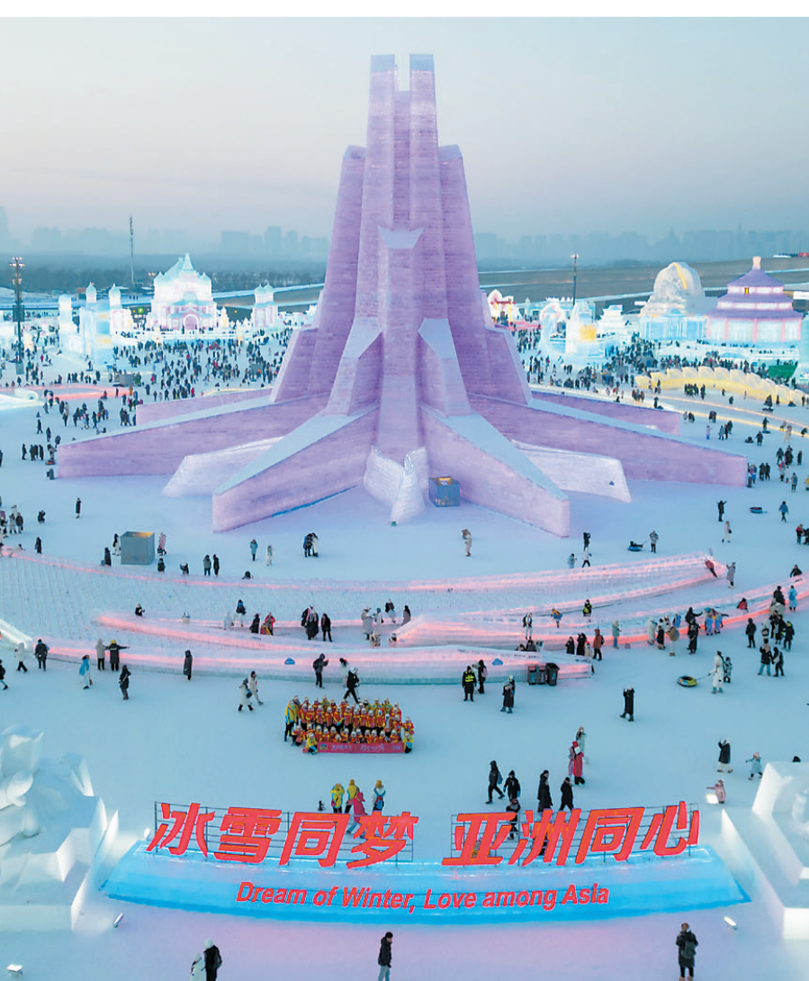
冰雪同梦 亚洲同心 Dream of Winter, Love among Asia

春节假期结束,亚冬会接踵而至,园区做好了更多中外游客来此打卡的准备。据哈尔滨冰雪大世界统计,自2024年12月21日开园以来,已累计接待游客数量突破266万人次。