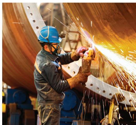
江苏省连云港经济技术开发区一家风力设备公司工人生产风电塔架。