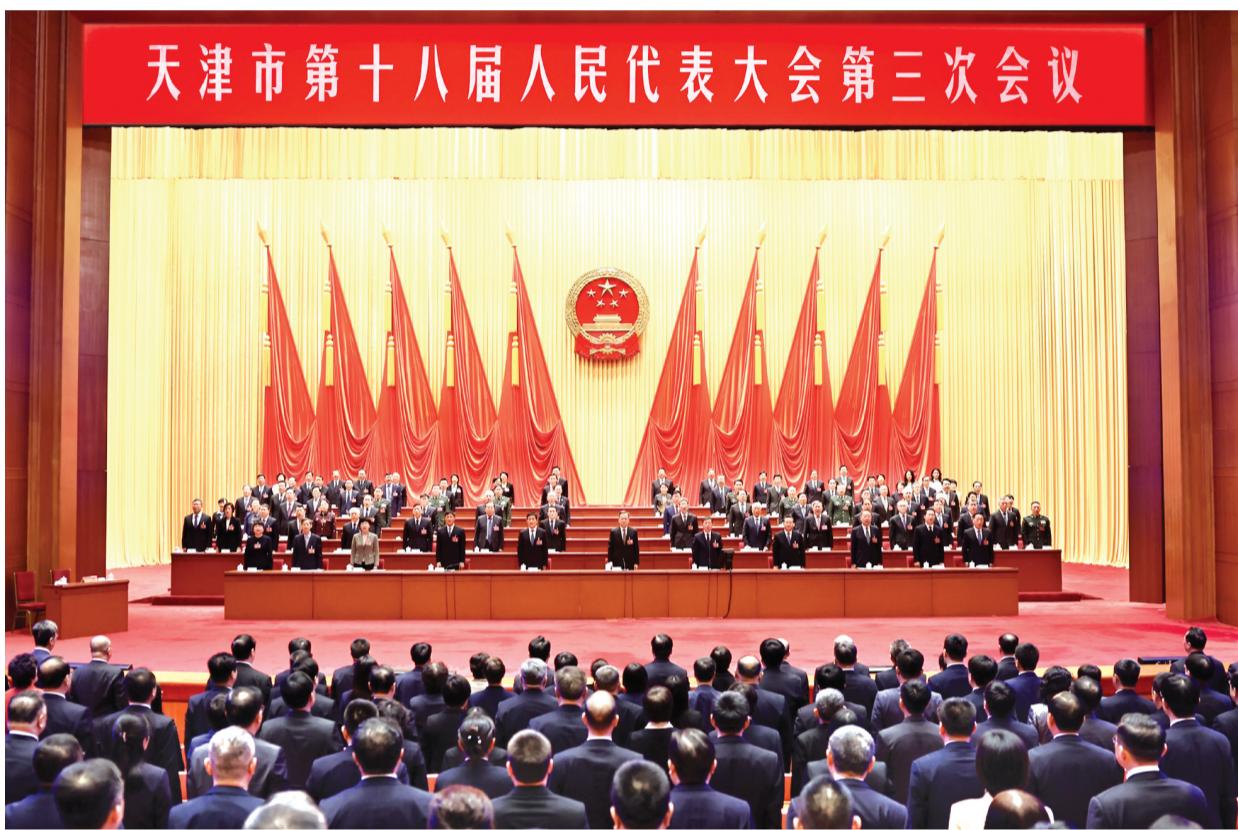
市十八届人大三次会议闭幕会主席台。

会议表决通过关于政府工作报告的决议等 通过《天津市大运河文化遗产保护传承利用条例》