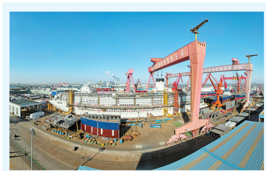
1月15日,第二艘国产大型邮轮H1509船(“爱达·花城号”)在中国船舶集团有限公司旗下上海外高桥造船有限公司2号船坞内实现全船贯通,全面转入全船内装工程、设备、系统调试“下半场”。相比于首艘国产大型邮轮“爱达·魔都号”,“爱达·花城号”总吨位增加了0.64万吨达14.19万吨,总长增加17.4米达341米,客房数量增加19间达2144间,满载游客容量5232人,配置高达16层的庞大上层建筑,增加更具体验感和娱乐化的相关设施。 新华社发

犯罪专项工作以来,公安机关会同缅甸执法部门持续开展执法安全合作和一系列打击行动,彻底摧毁臭名昭著的缅北果敢“四大家族”犯罪集团,缅北地区临近我边境的规模化电诈园区被彻底铲除,当地电诈犯罪生存空间被强力挤压,大批涉诈人员陆续向缅甸妙瓦底、万海、当阳等纵深地带转移。在严厉打击和广泛宣传的双重作用下,部分电诈园区出现了“用人荒”。境外电诈集团为维系园区“正常运营”,大肆通过“高薪招募赴境外务工”“免费出境旅游”等方式诱骗境内人员出境,再采取非法拘禁、绑架等手段强迫其在电诈窝点内从事违法犯罪活动,严重侵害人民群众生命财产安全,社会影响极其恶劣。 公安机关将持续保持对跨境电信网络诈骗犯罪的严打高压态势,特别是对缅甸妙瓦底等新的诈骗窝点聚集区,进一步加强国际执法合作力度,联合相关国家警方开展打击行动,全力捣毁境外电诈窝点,全力协调解救被困人员,切实维护人民群众生命财产安全和合法权益。