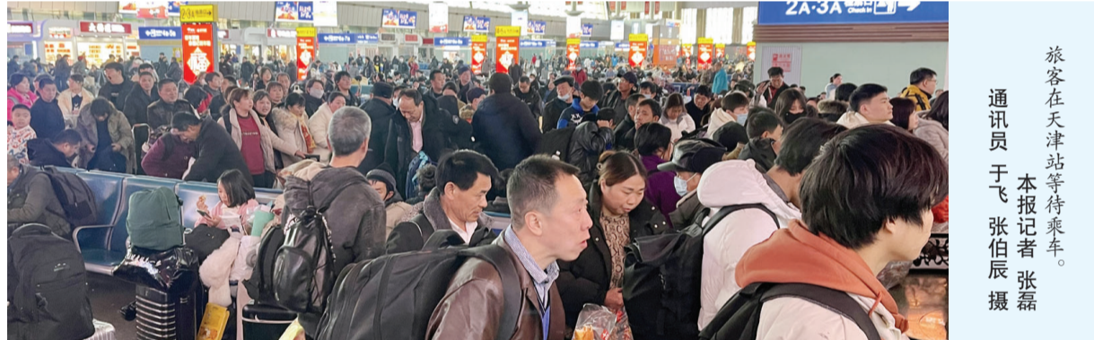
旅客在天津站等待乘车。

“春运期间,国际及地区旅客增多,我们定制的‘红黄蓝’三色手环,分别对应首乘、爱心、急客等不同旅客,同事们看到手环就能快速识别旅客需求,第一时间提供服务。”天津滨海机场客运服务部国际分部副主任赵宇说,“无论是值机、行李托运,还是安检、登机,我们都会拿出十二分热情,服务旅客平安出行。”