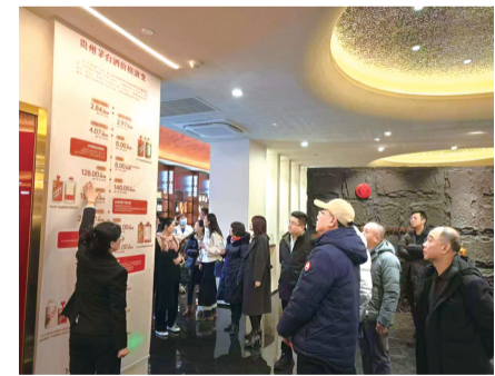
国际通行语言的角色,作为沟通的桥梁、友谊的使者,在国际贸易中活跃表现,推动了中华文化的传播。时代的变革催生了酒类消费文化的升华。九河下梢天津卫,国酒大观名酒荟,天津世界名酒荟顺应酒类市场消费升级和产业发展的潮流,以开放的姿态、国际化的视野、全力打造酒行业体验场景。

酒,是承载文化变迁、精神依托的重要载体。在千百年来的人类文明史中,酒几乎渗透于社会各个领域,俗话说,“无酒不成席,无酒不成礼”,追本溯源,中国是酒的故乡,是酒类产品的生产大国、消费大国、文化大国。随着我国改革开放的深入,酒类产品充当着