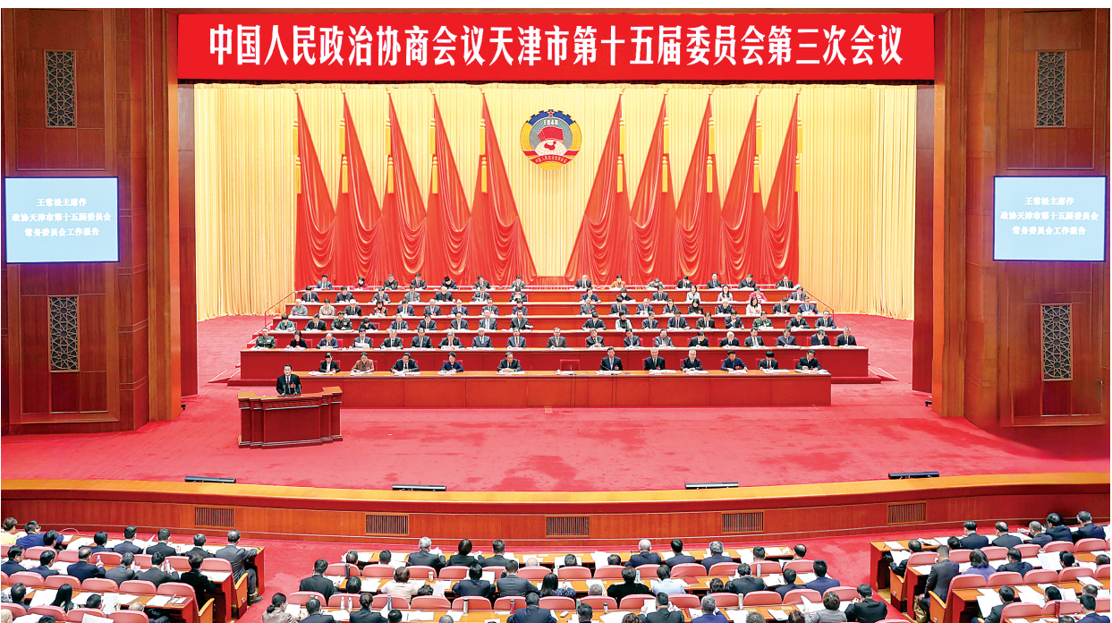
市政协十五届三次会议开幕会场。