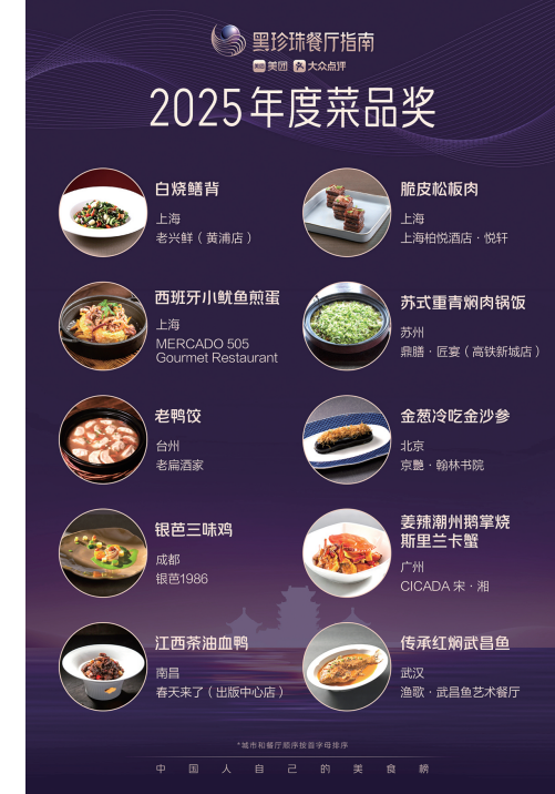
▲南昌、苏州、台州首次摘得“2025黑珍珠餐厅指南年度菜品奖”

会上,堪称网友心中的“全国十大名菜”——“2025黑珍珠餐厅指南年度菜品奖”同时出炉,这是全国首个大数据评选的精致餐饮菜品奖项,目的是为了倡导行业探索食材的无限可能和菜品的艺术性,而不是崇尚高价食材。