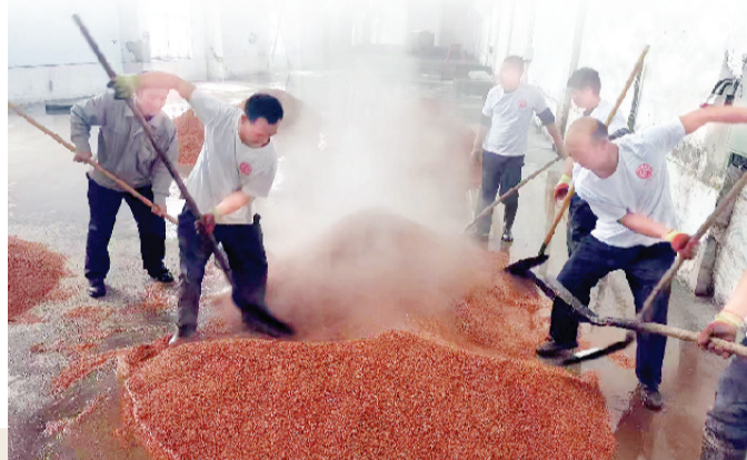
芦台春酿酒传统工艺,工人正在投料。

“宁河才郎俊,芦阳烧酒香。”退海之地,沃土万干;芦台名酿,享誉京畿。高粱红透,正逢其时,历经反复蒸煮、发酵、取酒,经年的自然融合,只为成就一道独特的馥郁酱香。