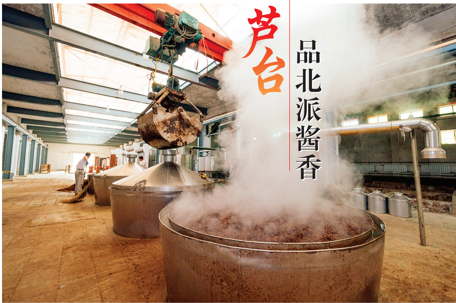
芦台春酒厂酿制车间。