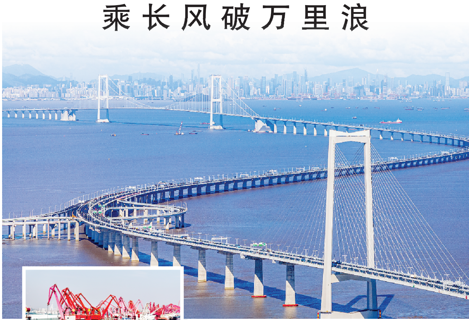
上图 车辆行驶在深中通道上。