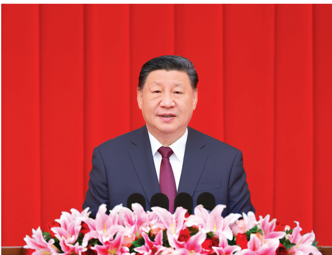
12月31日，全国政协在北京举行新年茶话会。中共中央总书记、国家主席、中央军委主席习近平在茶话会上发表重要讲话。