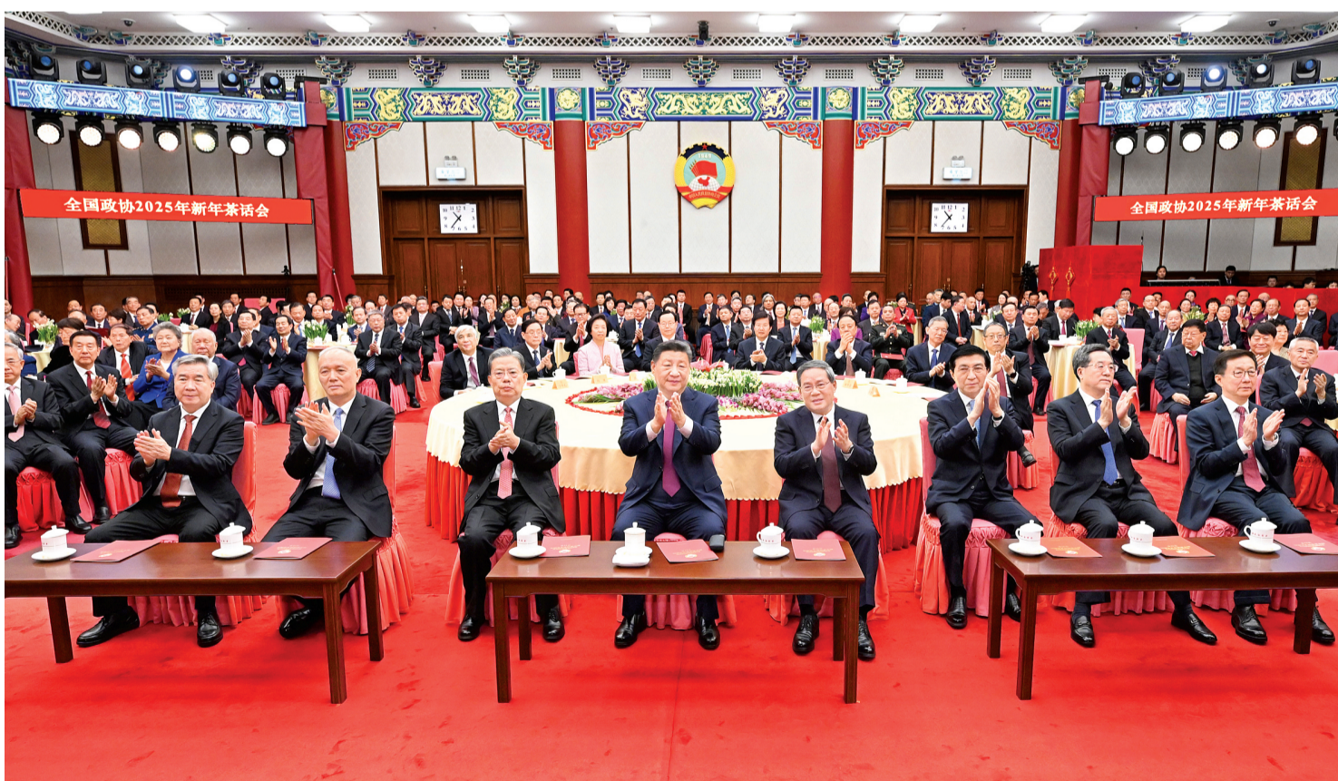
12月31日，全国政协在北京举行新年茶话会。党和国家领导人习近平、李强、赵乐际、王沪宁、蔡奇、丁薛祥、李希、韩正出席茶话会并观看演出。