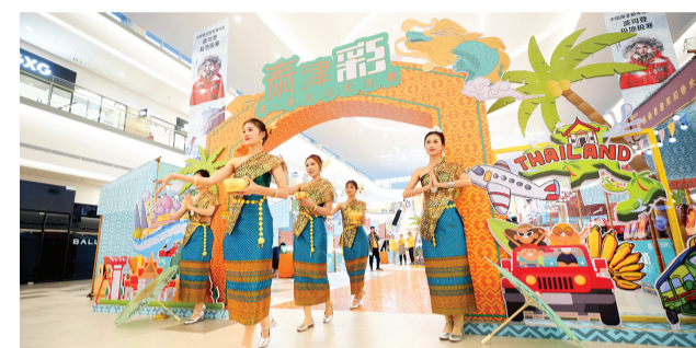
歌舞演员带来泰国传统特色表演。

本报讯(记者 马晓冬)2025年,中国与泰国将迎来建交50周年,近日,“世界泰津彩”泰国文化交流周活动在西青区天津杉杉奥特莱斯广场举办。