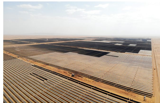
埃及总理马德布利14日在阿斯旺省宣布,由中国企业承建的康翁波光伏电站投入运营。康翁波光伏电站位于埃及南部阿斯旺省,占地10平方公里,装机容量500兆瓦,由中国能源建设股份有限公司承建。该电站投入运营后预计将为25.6万户埃及家庭提供电力。图为8月4日拍摄的位于埃及南部阿斯旺省的康翁波光伏电站(航拍照片)。

伊赫桑认为,叙利亚局势能否好转取决于未来政权能否妥善应对一系列挑战,包括能否避免深度卷入地区纷争;能否早日摆脱美西方制裁,吸纳国际援助和投资,开启重建进程;能否妥善解决人道主义危机、促进民生发展等。