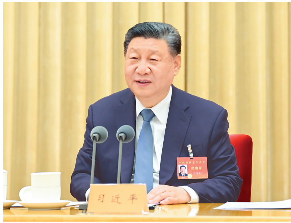
12月11日至12日，中央经济工作会议在北京举行。中共中央总书记、国家主席、中央军委主席习近平出席会议并发表重要讲话。

做好明年经济工作，要以习近平新时代中国特色社会主义思想为指导，全面贯彻党的二十大精神，坚持稳中求进工作总基调，完整准确全面贯彻新发展理念，加快构建新发展格局，扎实推动高质量发展，进一步全面深化改革，扩大高水平对外开放，建设现代化产业体系，更好统筹发展和安全，实施更加积极有为的宏观政策，扩大国内需求，推动科技创新和产业创新融合发展，稳住楼市股市，防范化解重点领域风险和外部冲击，稳定预期、激发活力，推动经济持续回升向好，不断提高人民生活水平，保持社会和谐稳定，高质量完成“十四五”规划目标任务，为实现“十五五”良好开局打牢基础