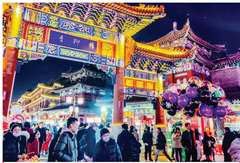
2024年春节假期,杨柳青古镇景区游客络绎不绝,大家在此沉浸式感受新春年味。

冯骥才说,我的祖祖辈辈一直把春节当作一年一度最重要、最期待、最美好的节日。中国农耕社会古老而漫长,人们生活和生产的节律依从大自然的规律与季候。春节处在旧的一年离去、新的一年到来的时候,此时人们对新生活充满梦想与希冀,故而创造出一整套异彩纷呈、极具魅力的风俗和民艺,以贺新年。