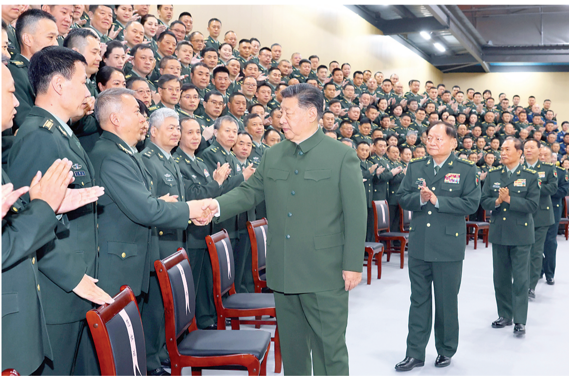
12月4日,中共中央总书记、国家主席、中央军委主席习近平视察信息支援部队,代表党中央和中央军委,对信息支援部队第一次党代表大会的召开表示热烈祝贺,向信息支援部队全体官兵致以诚挚问候。这是习近平同代表们亲切握手。