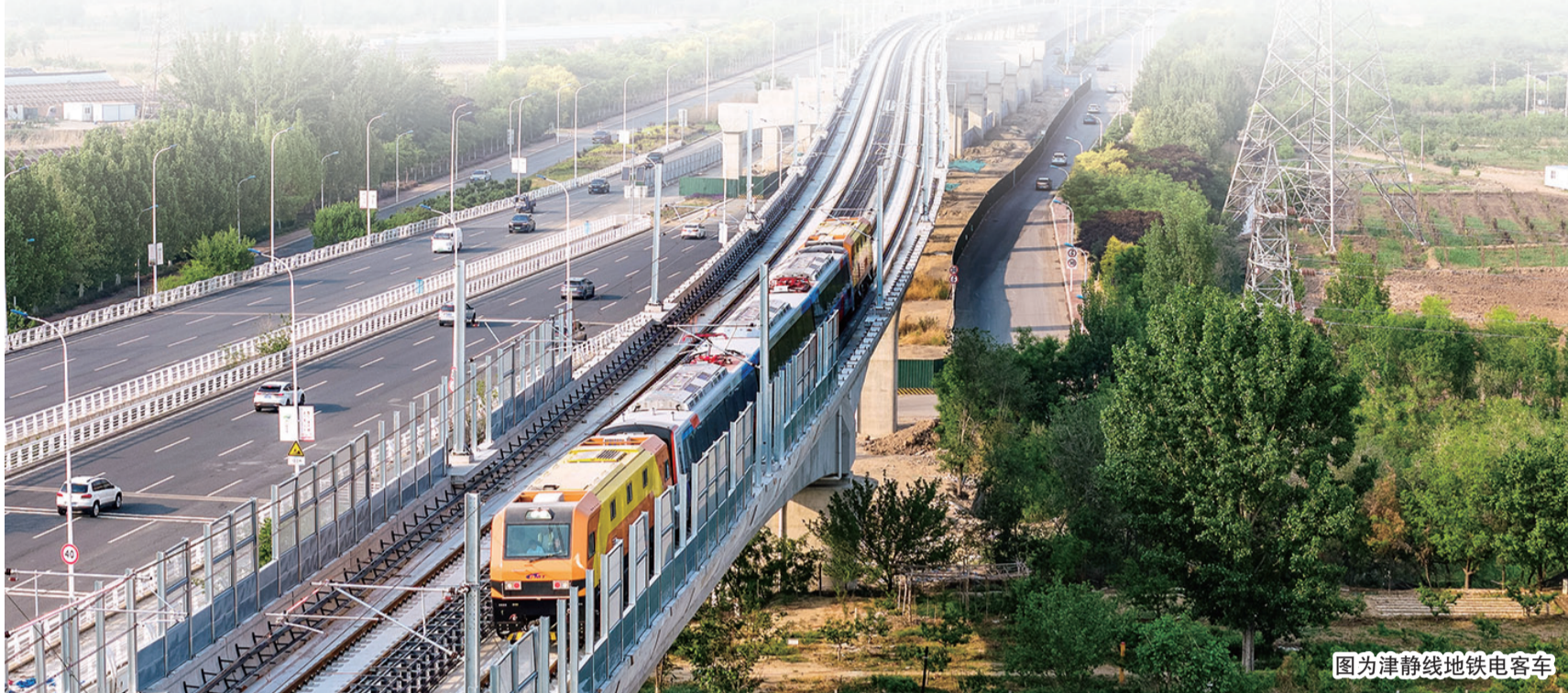
图为津静线地铁电客车

全市各级纪检监察机关深入贯彻党中央和市委关于推动高质量发展、让现代化建设成果更多更公平惠及全体人民的决策部署,立足职能职责,聚焦重点任务强化监督检查,找准切入点和着力点,以强烈的政治担当、有力的行动举措、务实的工作作风,全力服务保障我市2024年20项民心工程落地见效,确保每一项民心工程都经得起历史和群众的检验。