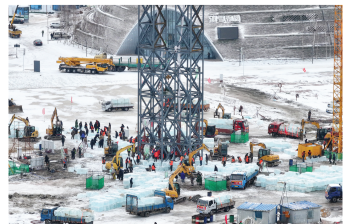
11月27日，第二十六届哈尔滨冰雪大世界冰建施工正式开始，园区内一片繁忙景象。图为工人在第二十六届哈尔滨冰雪大世界冰建施工现场作业（无人机照片）。

凌汛是黄河特有的汛情，由于黄河部分河段从低纬度流向高纬度地区，每年封冻、开河存在时间差，冬春时期易出现汛情。