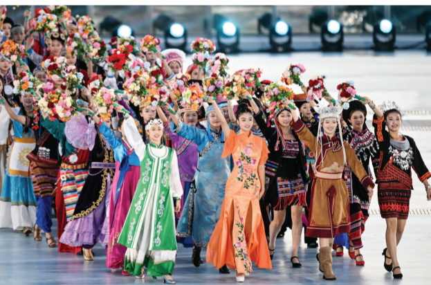
11月26日，第十二届全国少数民族传统体育运动会民族大联欢活动在海南省三亚市举行。