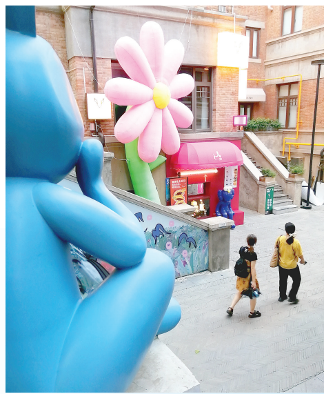
五大道棉里艺术街区