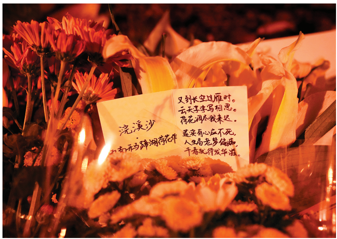
昨晚，南开大学师生在迦陵学舍前悼念叶嘉莹先生。

“我虽然没有上过叶先生的课，但是从文学作品和影视作品中了解她很多，当初报考南开大学就是受到叶先生的影响。”一名前来悼念的学生表示，“《感动中国》组委会在授予叶先生的颁奖词中说：‘你是诗词的女儿，你是风雅先生。’我觉得这非常符合她对南开、对中国的贡献。”