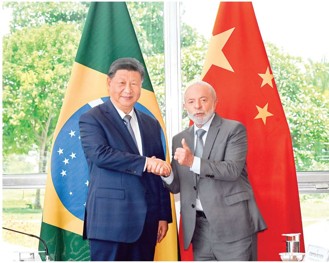
当地时间11月20日上午，国家主席习近平在巴西利亚总统官邸黎明宫同巴西总统卢拉举行会谈。