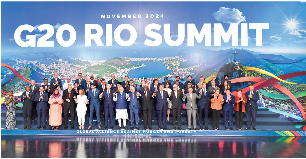
当地时间11月19日中午，国家主席习近平在里约热内卢出席二十国集团领导人第十九次峰会闭幕会议。这是闭幕会议后，习近平同其他与会领导人合影。

新华社里约热内卢11月19日电 当地时间11月19日中午，国家主席习近平在里约热内卢出席二十国集团领导人第十九次峰会闭幕会议。蔡奇、王毅陪同出席。