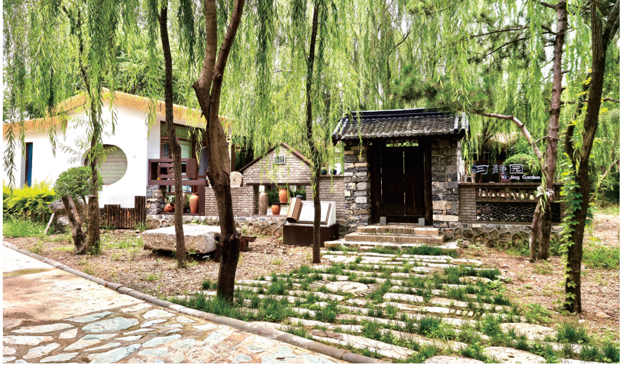
小穿芳峪村宁静的小院成为都市一族躲避闹市喧嚣的世外桃源

建行乡村振兴工作队长期在宝坻区驻点服务，肩负宣传金融风险防控政策知识、优化农村信用环境等多项职责。在了解到西刘举人庄村情况后，团队成员迅速整理材料向行内汇报，助力村集体经济实现多点开花。天津市分行有关部门积极与支行联动，组成“张富清金融服务队”下沉到村头院落、田间地头，了解村集体经济组织运营模式和活动开展情况，针对村集体融资需求，快速匹配了“集体信用贷”产品，仅用时两周就完成信用卡评分、500万