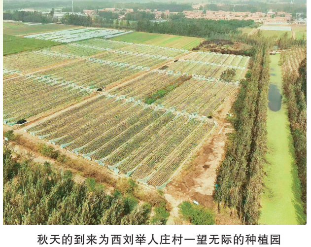
秋天的到来为西刘举人庄村一望无际的种植园披上“金色”的衣裳