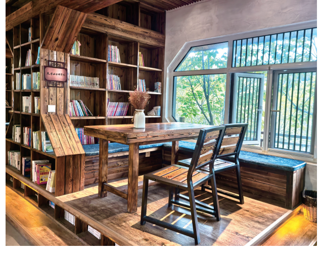
这里虽然没有鲁迅笔下“三味书屋”的历史沉淀，可惬意的环境也为淳朴的小穿芳峪村增添了一丝儒雅与书香