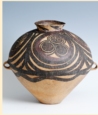
四大圈三圆网纹双耳彩陶罐。