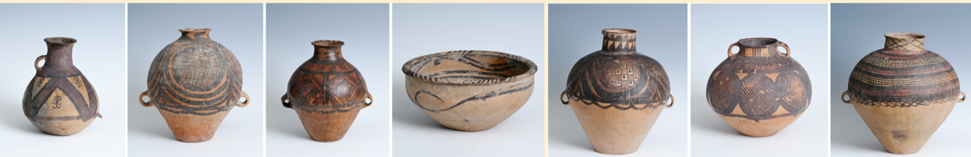
意大利返还中国的新石器时代马家窑彩陶器(11月5日摄,拼版照片)。