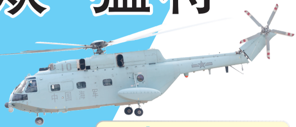
海军直-8C 运输直升机