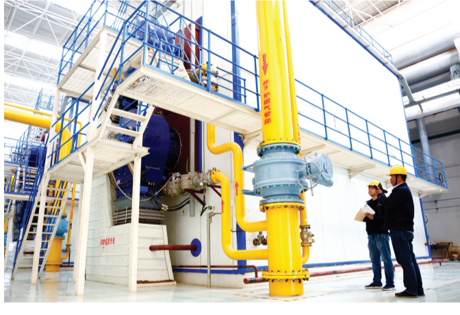
为做好供热准备,天津市津安热电有限公司红桥北供热服务中心热站工作人员针对调峰锅炉进行日常巡视,重点检查设备状态,确保燃气安全稳定供应。