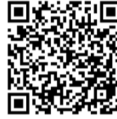
二维码扫一扫 参与签名活动