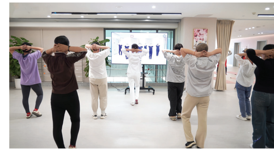
术后康复训练是乳腺癌患者全流程管理的重要环节。

乳腺癌是与基因突变具有较强相关性的癌症之一，常见的遗传基因是BRCA1和BRCA2。如果这两个基因发生变异，女性患乳腺癌的风险或增至普通人群的10倍以上。因此，具有乳腺癌家族史的人群，尤其是有两位以上一级亲属曾患乳腺