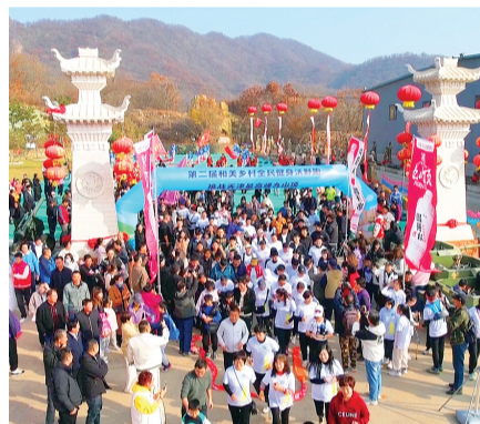
图为近千名马拉松运动员、爱好者和游客参加活动。

“好看!好吃!好玩!”有几个外地游客在奔跑中相识,他们围坐一桌,纷纷为这次活动竖起大拇指。