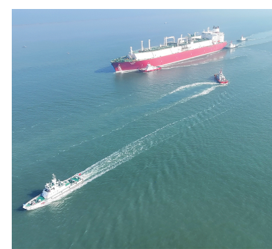
天津海事局护航LNG运输船舶“奥莱克”轮安全进港。

为确保持续LNG船舶航行安全,保障民生用气需求,天津、河北、山东、广西四地海事管理机构对“奥莱克”轮启动2024至2025年度LNG运输船舶专项时段联合安检。四地海事管理机构选派经验丰富的检