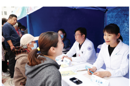
天津市健康中国行活动昨天在津南区小站镇文化活动中心启动。