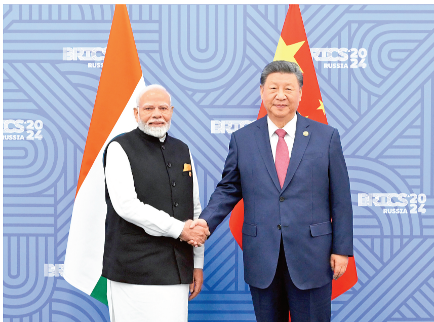
当地时间10月23日, 国家主席习近平在喀山出席金砖国家领导人会晤期间会见印度总理莫迪。

(上接第1版) 当务之急是全面有效执行联合国安理会有关决议, 尽快在加沙停火止战。只有把“两国方案”落到实处, 才能推动巴勒斯坦问题早日得到全面、公正、持久解决。中方赞赏埃方为推动停火止战所作努力, 愿同埃方加强协调配合, 共同推动巴以冲突早日平息, 地区局势走向缓和。