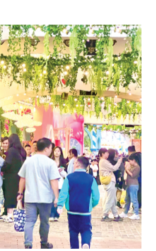
连日来,我市各大公园、游乐场充满喜庆气氛。